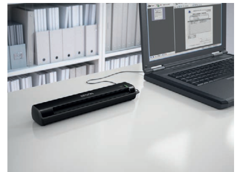
A DS-30 telepítése és használata egyszerű