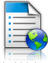
Úrlapok és kedvencek

A sorozat biztosította megoldások összehangolják a Lexmark flottakezelő eszközeit az Ön meglévő vállalatirányítási szoftverével és műszaki háttérével, létrehozva ezzel a Lexmark intelligens MFP-ökoszisztémáját. Ennek adaptálhatósága garantálja, hogy a színes Lexmark lézertechnológiába való befektetés a jövőben sem veszíti el az értékét.