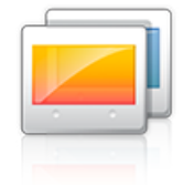
A kijelző testreszabása